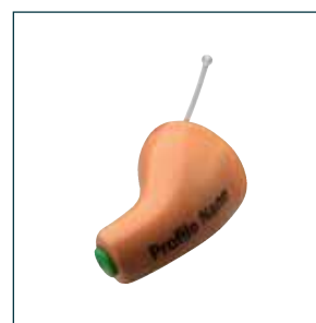
Profilo Nano beige