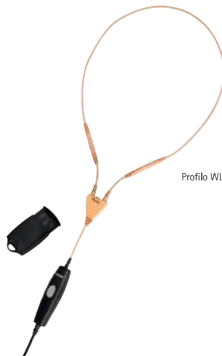
Profilo WL Kit AC beige