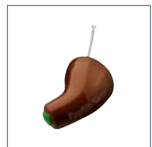
Profilo Nano braun