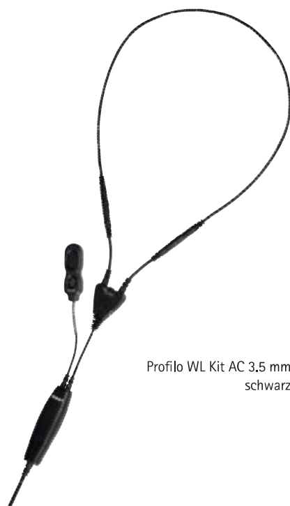
Profilo WL Kit AC 3.5 mm schwarz

Dieses Kit kombiniert die Profilo Transduktionsschleufe mit einer 2-Tasten-PTT.