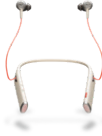
VOYAGER 6200 UC

Büroangestellte und externe Mitarbeiter, die einen komfortablen Bluetooth-Nackenbügel mit Ohrstöpseln benötigen