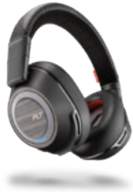
VOYAGER 8200 UC

professionelle Anwender, die in Umgebungen mit störenden Geräuschen, unterwegs oder im Büro arbeiten