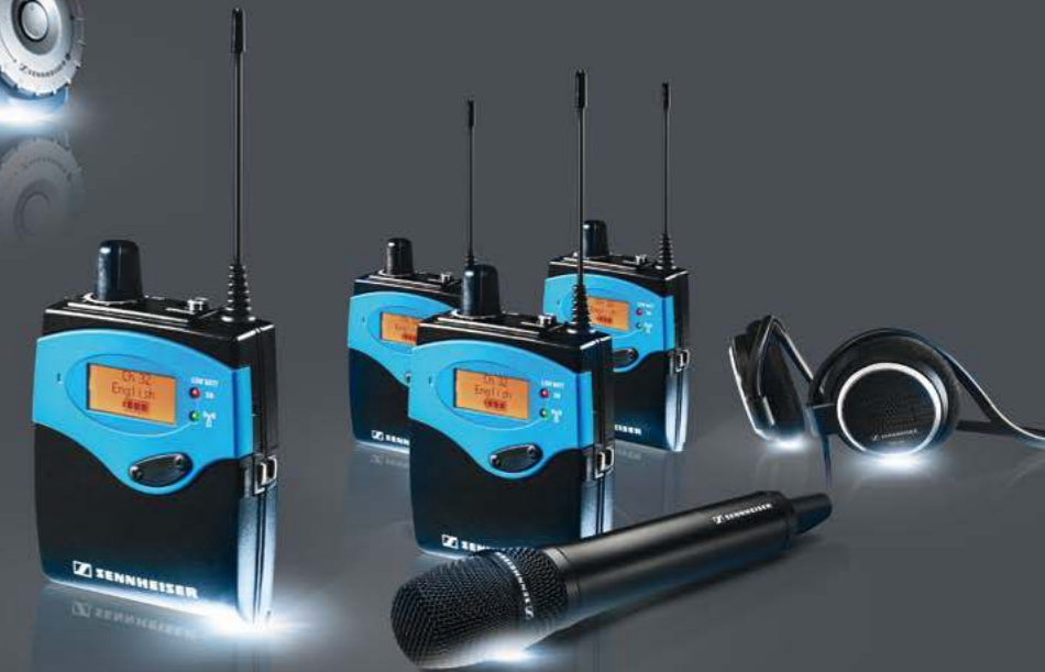
Tourguide EK 1039