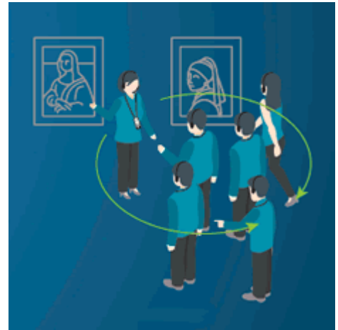
Live Tour mit Guide