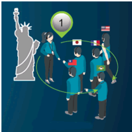
Mehrsprachige Tour (Guide startet Abspielen des gespeicherten Inhalts auf Knopfdruck)