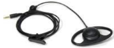
Kopfhörer (Der Klinkenstecker muss 3,5mm, 4-polig vom US-Typ sein)